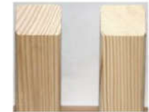
Profil Nr.: 104