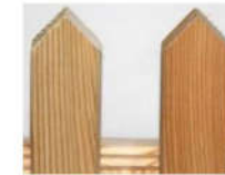
Profil Nr.: 103