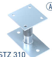
STZ 310 H: 120-160 mm