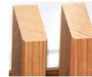
Profil Nr.: 102