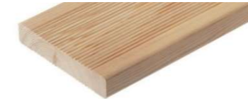
sibirische Lärche geriffelt