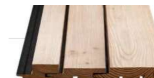
Barcode Optik Nut+Feder