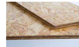
OSB-Platten Nut- und Feder